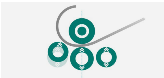
3. Einrunden bis zur Übergabe an die andere Seitenwalze