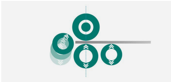
1. Blech einlegen und ausrichten, die Seitenwalze dient als Anschlag