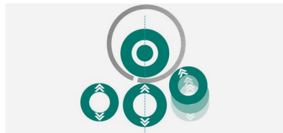
4. Zweite Anbiegung am Ende der Rundung