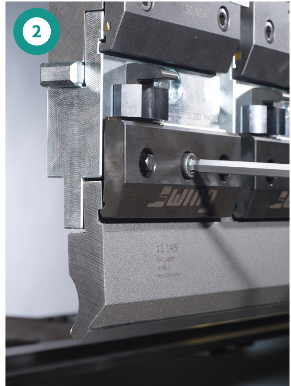
Schraube lösen, das Oberwerkzeug ist gegen Herunterfallen gesichert