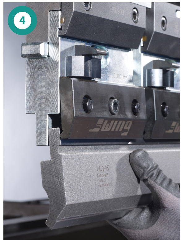
Oberwerkzeug vertikal herausnehmen